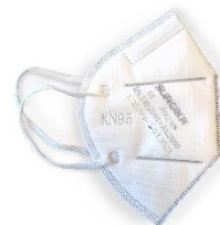
Vista lato esterno.